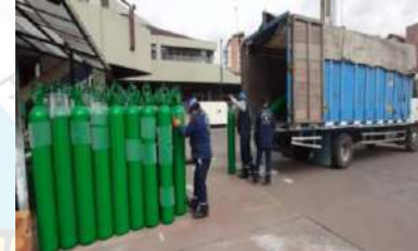
Recursos Estratégicos/ Oxígeno/ EPP