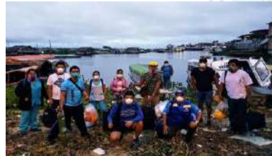
No proveedores/Cierre puertos/aeropuertos