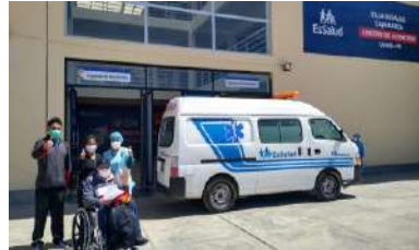
Limitada Infraestructura y Equipámiento