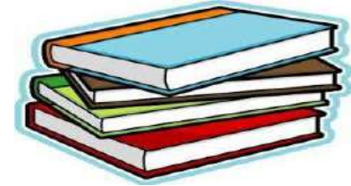
Protocolos y Ttos desconocidos