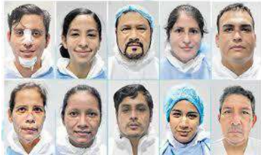
Brecha RRHH/ Vulnerables

IX CONVENCION NACIONAL DEL COLEGIO QUÍMICO FARMACÉUTICO DEL PERÚ - 2022