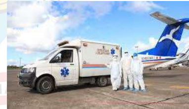
Evacuación pacientes Críticos (UCI)